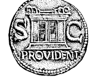
שני צדי איסר

האיסר היה אחת מן המטבעות הקטנים (אף כי הפרוטה היתה אך שמינית האיסר), ובדרך כלל עשוי נחושת. גדלו של האיסר משמש כציון גודל בכמה עניינים בתלמוד.